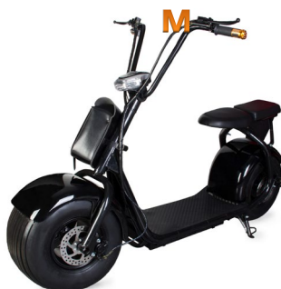
Но категории «Скутер» ТС нет Смотрим объем двигателя и скорость